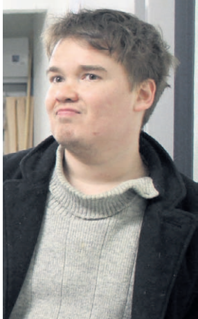
Turus Hessun Raivaaja-sarja ja Heikkis Antin eloisat poiminnat siitä muodostavat hyvän lähtökohdan kesän Rintamalta raiviolle -esityksille.