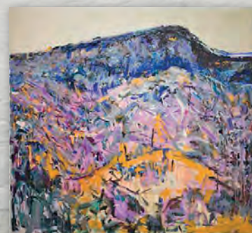
Tapani Mikkonen: Koli, akryyli kankaalle, 200x185cm, 2013.

Näyttely avoinna 11.6.-21.8. ma-pe klo 11.00-17.00 sekä Vaskiviikon konserttien aikana