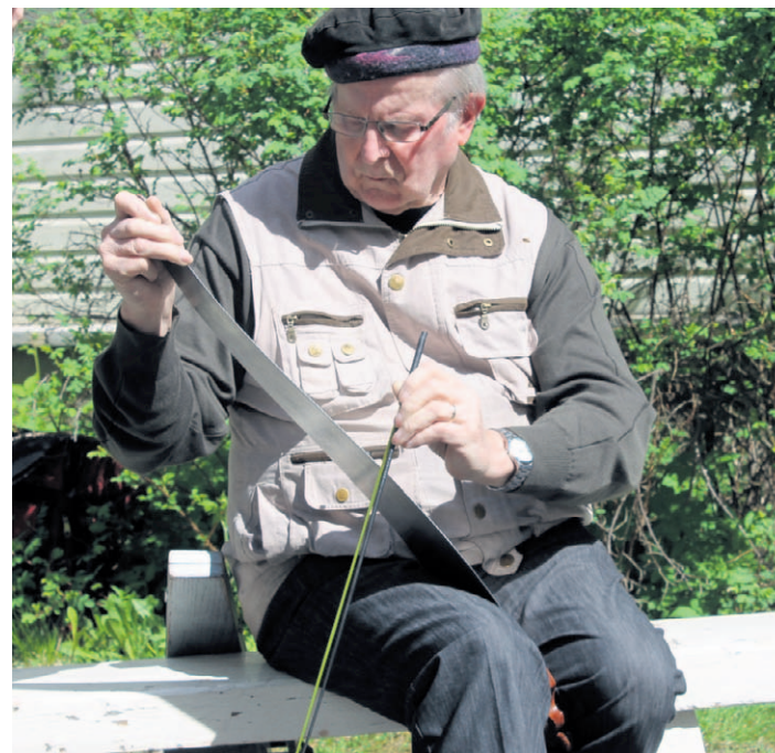
Sahakin soi Vuonislahdessa kesäkauden avajaisissa.